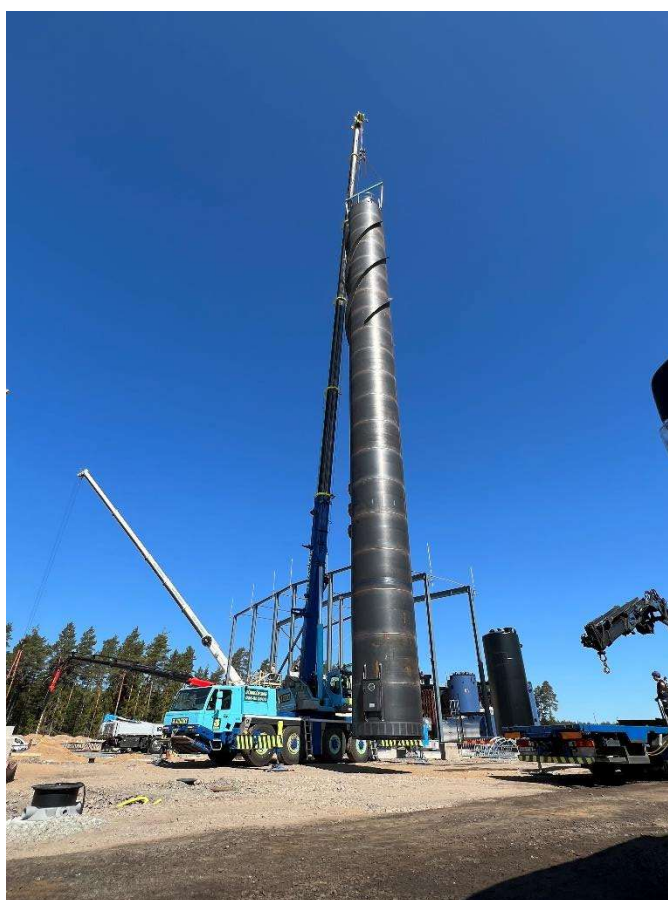
Uppförande av skorsten vid byggnation av nytt fjärrvärmeverk.